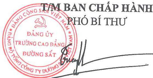
Trương Trọng Vương